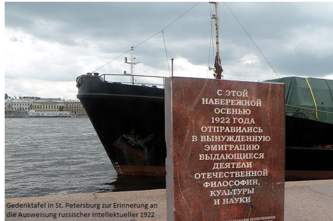
Gedenktafel in St. Petersburg zur Erinnerung an die Ausweisung russischer Intellektueller 1922

Anmeldung: bis 9. November 2017 unter +49 (0) 35873 338-40 oder info@komensky.de